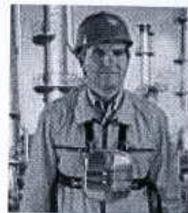
SSR 30/100 B